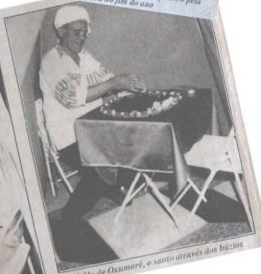
Naldo de Oxumaré, o santo através dos búzios